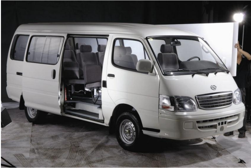
XMQ 6520 15 places